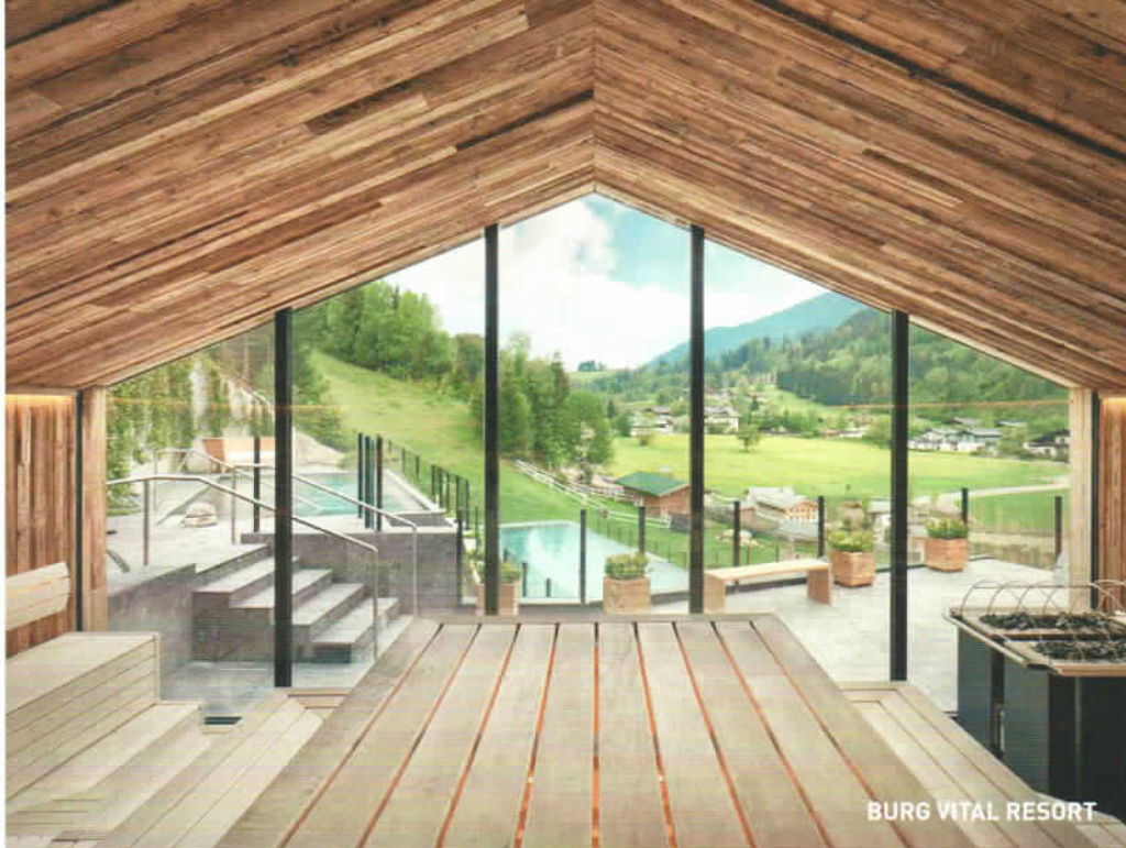
BURG VITAL RESORT