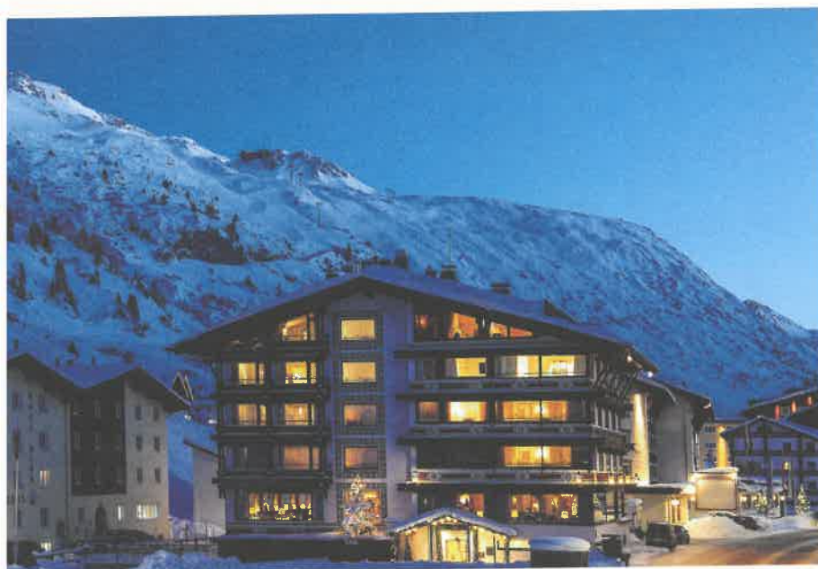
Thurnher's Alpenhof A-6763 Zürs am Arlberg +43 (0) 5583 2191 www.thurnhers-alpenhof.com

Urlaub in Thurnher's Alpenhof heißt auch Auszeit im Luxus-Familienbetrieb auf 1.717 Metern. Ausgezeichneter Service, traumhaftes Ambiente und vieles mehr erwarten den Gast inmitten einer imposanten Winterlandschaft. Das wissen auch Gäste aus aller Welt und viele Prominente aus Wirtschaft, Politik sowie Adel zu schätzen. Sie alle lieben die einzigartige Atmosphäre des traditionsreichen und doch so modernen Hauses. Luxus mit Seele, Gastfreundschaft und das „Außergewöhnliche“ stehen hier an oberster Stelle. Völlig zurecht ist Thurnher's Alpenhof Mitglied bei „The Leading Hotels of the World“ und wurde bereits zum 13. Mal mit dem 5 Star Diamond Award der American Academy of Hospitality Sciences ausgezeichnet. Die 14 Zimmer und 24 Suiten – in klassisch-elegantem Design gestaltet bis zum alpinen Chalet – sind äußerst charmant. Jeder Raum im Alpenhof hat seinen eigenen Stil. Von der Leinen-Tischdecke bis zur Kunst an den Wänden ist alles vom Feinsten und spielt virtuos zusammen. Gekrönt durch Panoramafenster mit Blick in die Vorarlberger Berglandschaft. Übernachten mit noch mehr Privatsphäre geht in den Serviced Apartments Thurnher's Residences gleich nebenan.