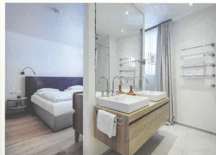
Thurnher's Residences A-6763 Zürs am Arlberg +43 (0) 5583 2191 www.thurnhers-alpenhof.com